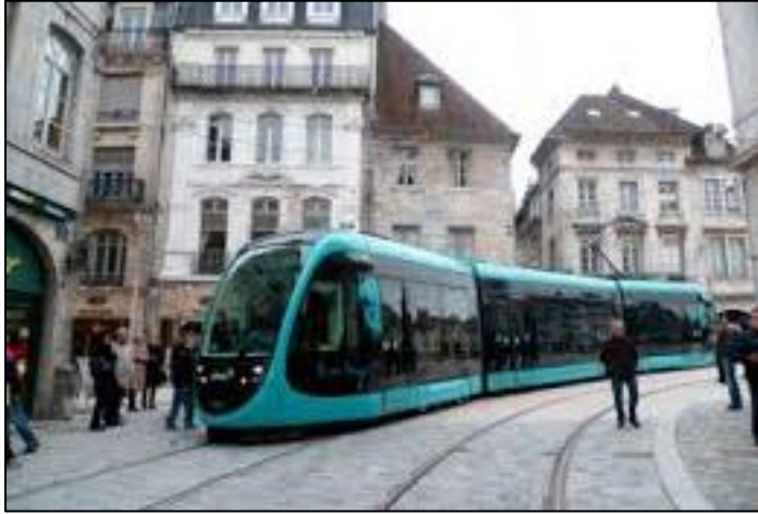
BESANÇON 2 lignes (en centre ancien resserré)