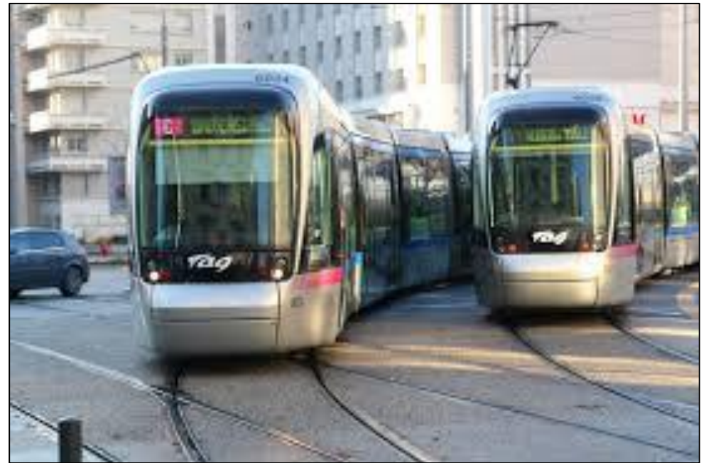
GRENOBLE 5 lignes (en centre-ville tortueux)