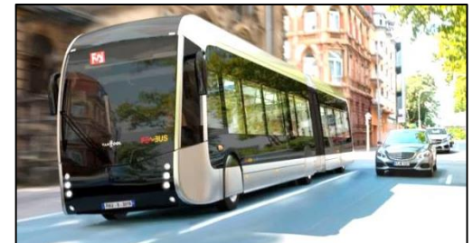
Futur BHNS Pau