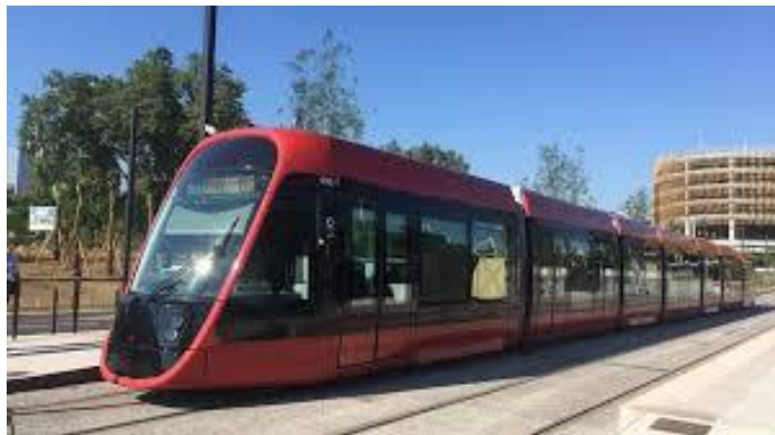
NICE 3 lignes bientôt (entre mer et montagne)